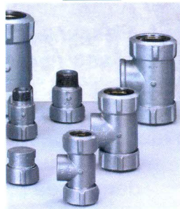
Cuplaje de 4" (dublu, cu filet interior sau exterior)